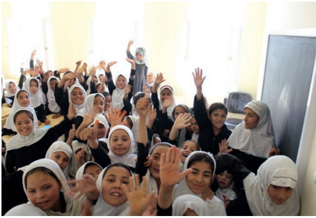
Kinder bei der Eröffnung ihres neuen Schulgebäudes in Hamdard, nahe Mazar-e Sharif