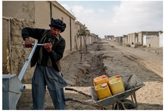
Ein Binnenflüchtling pumpt Trinkwasser für seine Familie aus dem neu errichteten Brunnen