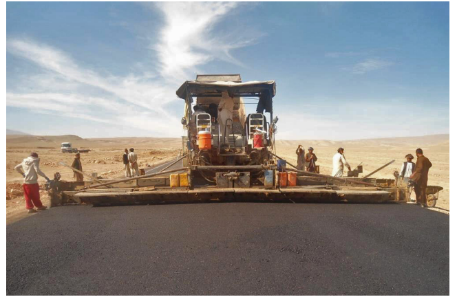
راه ترانسپورتی بهتر برای منطقه

حدود ۱,۷ میلیون نفر از دسترسی به مرکز فعالیت های اقتصادی مزار شریف بهره مند می شوند.