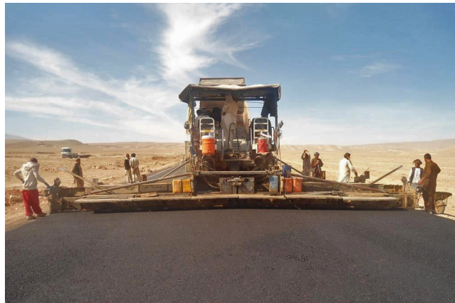
د سیمې د وگړو لپاره د ټرانسپورټ ښه لاره

نږدې ۱.۷ میلیونه خلک به د مزار شریف اقتصادي مرکز ته له غوره لاسرسۍ څخه گټه پورته کړي