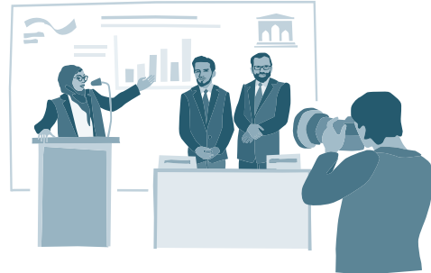
۱۴۰۰ افغان ژورنالېستانو له ۲۰۱۳ زېږدیز کال راهیسې د افغانستان سره د آلمان د همکارۍ په اړه په مطبوعاتي غونډو کې ګډون کړی دی.

د همکارۍ اقدامات او پایلې په مستقیم ډول لېوالو خلکو ته د لاسرسۍ رامنځته کولو لپاره، ډېرې پروژې د germancooperation-afghanistan.de په وېبپاڼه کې وړاندې کېږي. دا وېبپاڼه په دري، پښتو، انګلیسي او آلماني ژبو کې شتون لري او په منظم ډول نوی کپېږي. د افغانستان سره د آلمان د همکارۍ وروستۍ پایلې همدارنګه د فیسبوک چینل "German Cooperation with Afghanistan" له لارې هم خپریږي.