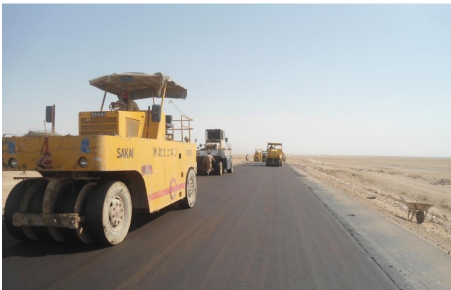
په ښه توگه جوړ شوي سړکونه بازارونو ته لاسرسي لرلو ته وده ورکوي

د افغانستان د شمال د ولايتي سلاکارانو (PANA) پروگرام د خپلې اصلي دندې په توگه، ولايتي ادارو ته د مشورې ورکولو سربيره د کوچنۍ کچې پروژو ملاتړ هم کوي. د خپلو افغان ملگرو سره د مستقيمې همکارۍ له لارې، دې پروگرام د ۲۵۰۰۰۰ يورو په ارزښت، ۴۰ دا ډول پروژې پلي کړې دي.