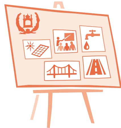
د ۲۰۱۶ کال راهيسې، د افغانستان د شمال د ولايتي سلاکارانو (PANA) پروگرام د افغانستان په شمالي ولايتونو کې د ۳۵۰۰۰۰ يورو په مجموعي ارزښت شاوخوا ۴۰ د کوچنۍ کچې پروژې پلي کړې دي.

دا پروگرام ولايتي ادارو ته له افغانستان سره د آلمان د همکارۍ د اصولو، لومړيتوبونو او موخو په هکله معلومات ورکوي او هغو ته خپلې پروژې او پروگرامونه معرفي کوي. دا پروگرام د افغانستان په شمال کې د ولايتي ادارو او له افغانستان سره د آلمان همکارۍ په گډو موخو تمرکز کوي. د