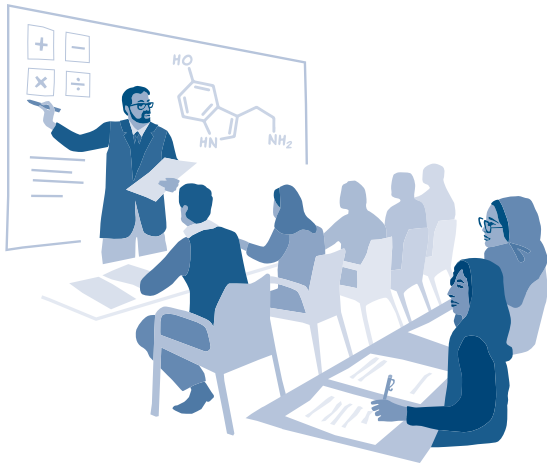
۱۴۰ ښوونکو د ریاضي، طبیعي علومو، معلوماتي ټکنالوژۍ، آلماني او انګلیسي ژبې زده کړې ترلاسه کړې دي

د یو بريالي ښوونځي لپاره یو ترټولو مهم عامل د هڅول شویو او ښو مسلکي ښوونکو شتون دی چې د په زړه پورې درسونو د وړاندې کولو وړتیا ولري. دا ښوونکي د ښوونځي ماشومان هڅوي چې په درسونو کې فعاله برخه واخلي. دا پروژه شاوخوا ۱۴۰ ښوونکو ته د ریاضي، طبیعي علومو او معلوماتي ټکنالوژۍ په برخه کې روزنیز کورسونه په لاره اچوي. د بهرنیو ژبو په توګه د الماني او انګلیسي ژبو ښوونکي هم ملاتړ ترلاسه کوي. د پروګرام په پیل کې، ۲۴۰ ښوونکو د تعلیم فنون او له تاوتریخوالي تشې ښوونې او روزنې په تړاو روزنه ترلاسه کړې ده. الماني د دې دريو نمونوي ښوونځیو په نصاب کې د لومړۍ بهرنۍ ژبې په توګه ځای په ځای شوې او انګلیسي د دوهمې بهرنۍ ژبې په توګه وړاندې شوې ده.